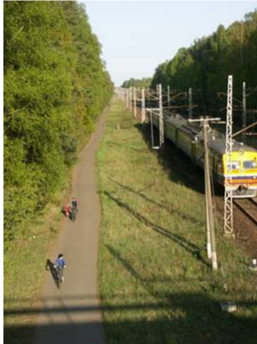
Attēls 4. Veloceliņš Rīga - Jūrmala