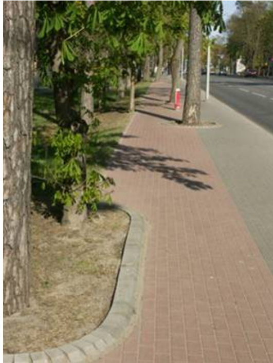
Attēls 2. Ar sarkanu bruģi veidots veloceliņš Majoros