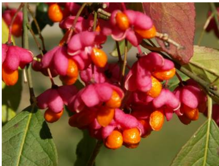
Attēls 1. Zalktenes augļi

Alerģiskas reakcijas var būt arī no dažādiem divspārņiem – odiem, dunduriem, knišķiem u.c. kukaiņiem.