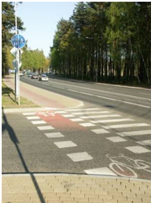
Attēls 3. Marķēts veloceliņš Lielupē