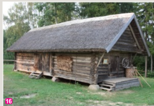
Andrupenes lauku sēta