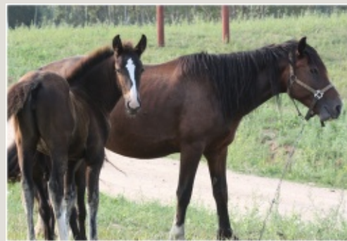
Latgales zirgi Rudo kumeļu pauguros