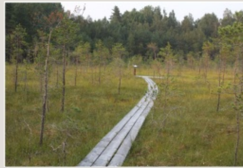
Laipu taka Andrupenē