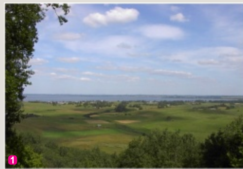
Skats uz Rāznas ezeru no Mākoņkalna

18 Mākoņkalns – viens no populārākajiem nacionālā parka un Latgales novada tūrisma objektiem. Tā piekāvē izveidots labiekārtots autostāvlaukums, bet tā virsotnē uzved koka kāpnes. Mākoņkalnā atradusies 13. gs. celtā, praktiski neieņemamā Livonijas ordeņa Volkenbergas pils, no kuras līdz mūsdienām saglabājušies tikai pils aizsargmūra fragmenti. No lielpaugura plakanās virsotnes (247 m v.j.l., ap 60 m virs tuvākās apkārtnes) paveras viena no skaistākajām Latgales ainavām uz Rāznas ezeru. Teikas vēsta, ka pēc Volkenbergas pilskunga un viņa sievas nāves plašie pilsnovada īpašumi esot sadalīti viņu trim meitām – Rozei, Lūcijai un Marijai. Katra no māsām uz mantotās zemes uzcēlusi jaunu pili: Roze – Rēzekni, Lūcija – Ludzu, bet Marija – Viļaku. Mākoņkalna pakājē atklāta piemiņas plāksne – atgādinājums par 1938. gada Latvijas pirmās brīvvalsts prezidenta Kārļa Ulmaņa Latgales apmeklējumu.