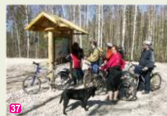
Informācijas stends Kalnciema - Kūdras ceļa malā