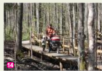
Melnalkšņu dumbrāja taka