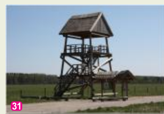
Putnu vērošanas tornis Dunduru pļavās