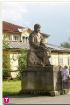
Pieminekļis I. Pavlovam

39 Vecie kūdras karjeri - nākamā vieta aiz Ķemeriem, kur jau daudz lielākā