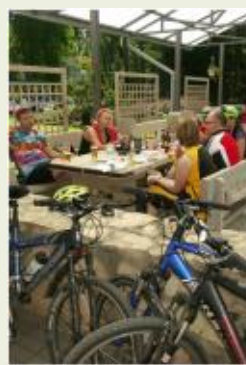
Kafejnīca "Valguma pasaule"